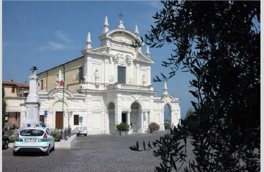
L'église Santa Maria