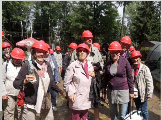
le tunnel "Włodarz"