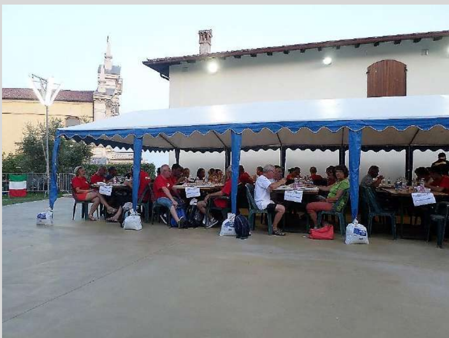
Une partie des délégations sous les tonnelles du restaurant, sur la plage du village de Polpenazze.