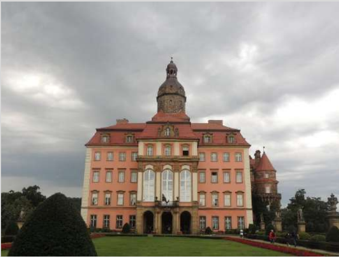
le château Książ,

Pendant notre séjour, nous sommes allés en Basse-Silésie pour visiter :