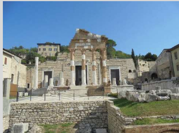
le temple Capitolino,