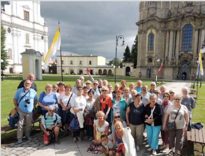
et l'abbaye de Krzeszów.

Le soir, nous avons été surpris par un orage très violent. Au retour à Gostyń nous avons vu des dégâts importants causés par la tempête. Les Français ont participé à une quête, qui a rapportée 750€, pour les sinistrés de Brzezic (une famille de 7 enfants). La maison a brûlé entièrement.